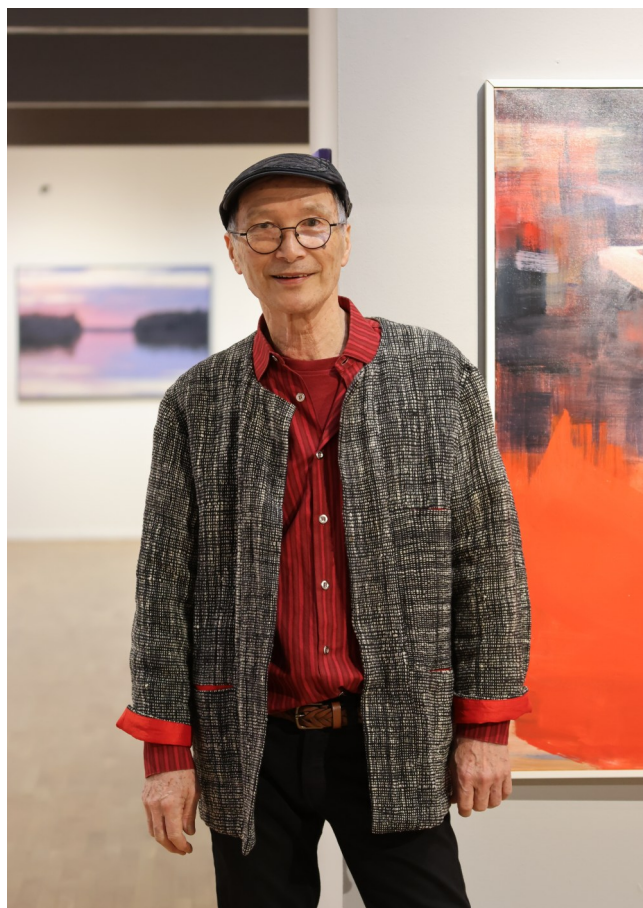
Kuvataiteilija, taidemaalari Tatsuo Hoshika kuvattuna Taidetta Pohjantähden alla -näyttelyssään.