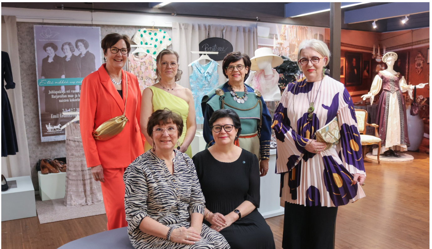
Kuvassa näyttelyn työryhmää Harjavallan maa- ja kotitalousnaiset ry:stä.

Kaikkia juhlapukuja yhdistää se, että niihin nivoutuu lukuisia tarinoita kantajiensa elämän merkkihetkistä. Pukuihin liittyviä muistoja on esillä näyttelyssä myös kirjoitettujen kertomusten muodossa. Näyttely on matka juhlapukeutumisen historiaan, mutta samalla matka monen ihmisen elämän merkityksellisimpiin juhlapäiviin, tarinoihin ja muistoihin. Juhlapukujen ohella nähtävillä on myös muuta juhla-kulttuurista kertovaa esineistöä, kuten pukuihin kuuluvia asusteita ja kenkiä, koruja, koristeita, päähineitä ja käsineitä.