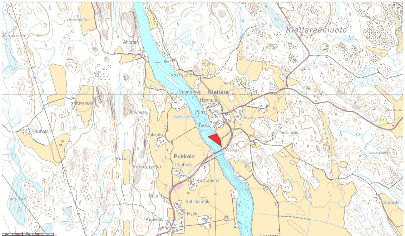
Kuva 2 Nimetön koski- ja virta-alue 3 (61°14' 12.1", 22°29' 33.8")