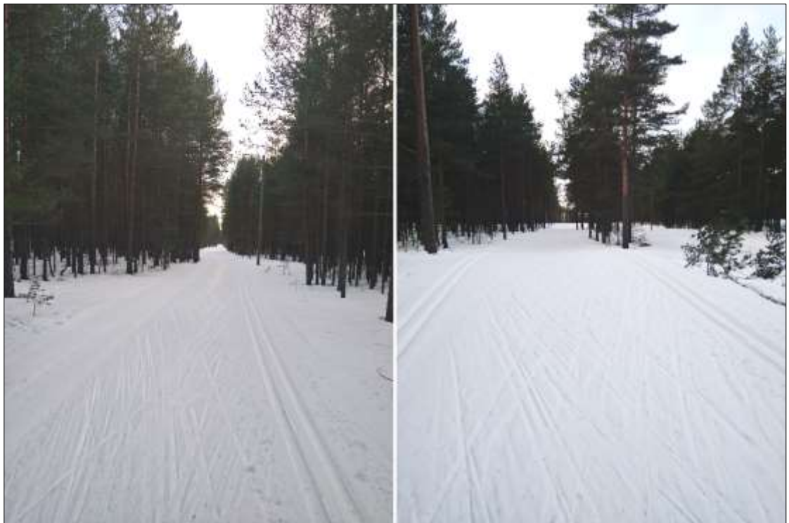
Kuva 1. Ulkoilureitillä hoidetaan talviaikaan hiihtolatua (2/2024 Harjavallan kaupunki).

Ulkoilureittisuunnitelman linjaus noudattaa nykyistä 5 kilometrin valaistua kuntoilureittiä. Linjaus käy ilmi liitteenä 1 esitetystä suunnitelmakartasta. Lumettomaan aikaan reitti palvelee muun muassa kävelijöitä ja maastopyöräilijöitä. Talvella reitillä hoidetaan hiihtolatua. Ulkoilureittisuunnitelmaan on lisäksi rajattu liitännäisalueita, joita ovat muun muassa latukoneen kääntöpaikka sekä laavulle ja reittiopasteille varattavat alueet.