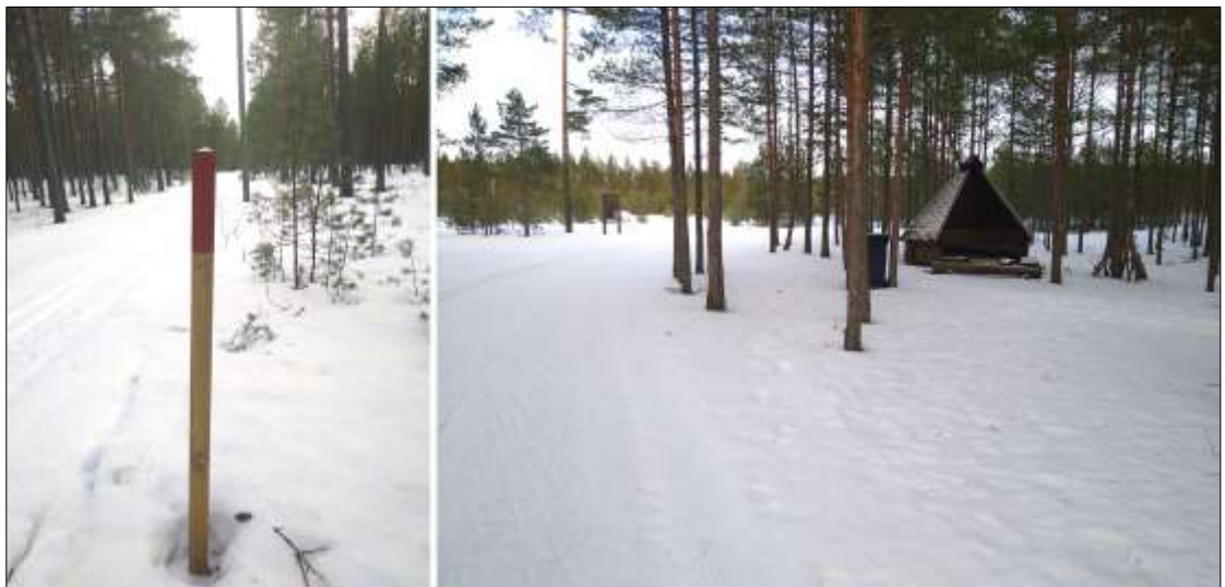
Kuva 2. Vasemmalla reittimerkintä, oikealla reitin varrella oleva kotalaavu (2/2024 Harjavallan kaupunki).

Hiittenharjun ulkoilu- ja virkistysalue sijaitsee 1-2 km etäisyydellä Harjavallan keskustasta. Alue on saavutettavissa erinomaisesti jalkaisin ja polkupyörällä. Ajoneuvoilla alueelle saavutaan joko Hiittenharjun hiihtokeskuksen (Hiittenharjuntie) kautta tai tanssihallin (Liikuntatie) suunnalta. Pysäköintialueet löytyvät kummastakin lähtöpaikasta. Ulkoilureitti on valaistu led-valaisimin. Reitti on merkitty puupaaluin, joissa on punaiset merkinnät. Ulkoilureitin varrella on lisäksi suuntaviittoja, reittikarttoja ja laavu, jossa on tulentekopaikka.